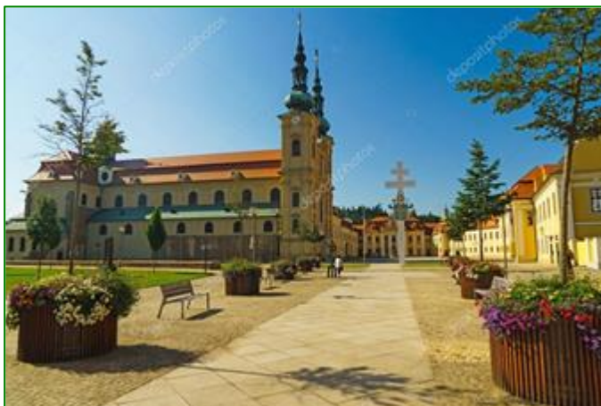
klooster van Velehrad

Voor de Head of Jurisdictions is op 8 April de Head of Jurisdiction-, de hospitaller- / en de Spiritual Advisory Council meeting.