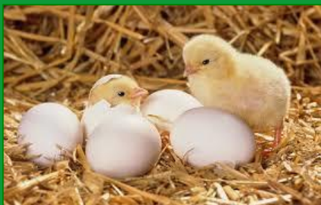
nieuw leven, nieuw begin