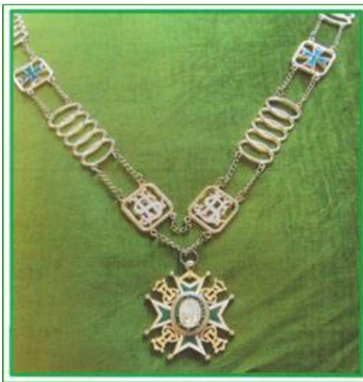
Collar of Office

De Collar of Office is de officiële ambtsketen van bepaalde ambtsdragers en geen onderscheiding voor verdienste.